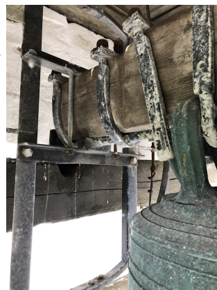
Resen Kirkes klokke